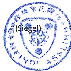
Hans Fent Erster Bürgermeister