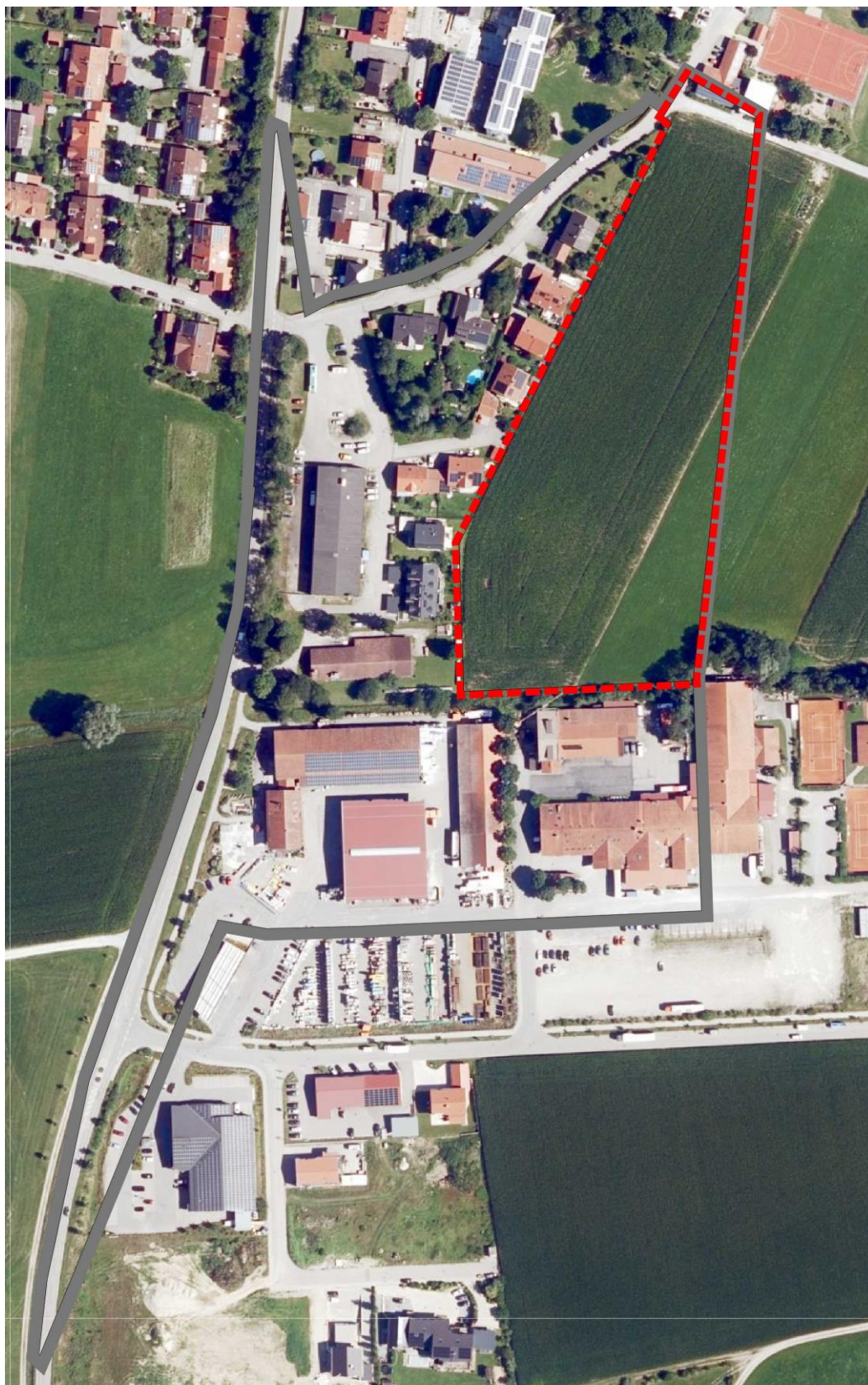
Abb. 1 Plangebiet mit Umgriff des rechtskräftigen Bebauungsplans „Am Schwartlinggraben“ (grau) und dem Umgriff der Teilaufhebung (rot), ohne Maßstab