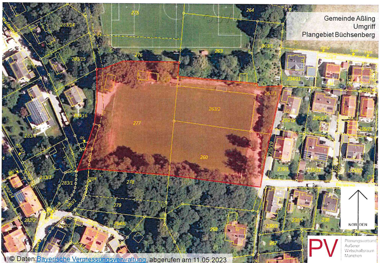
Abb.1: Geltungsbereich des Bebauungsplans „Am Büchsenberg II“ ohne Maßstab

Der Geltungsbereich des Bebauungsplans ist aus nachfolgendem Lageplan ersichtlich, der Bestandteil der Bekanntmachung ist: